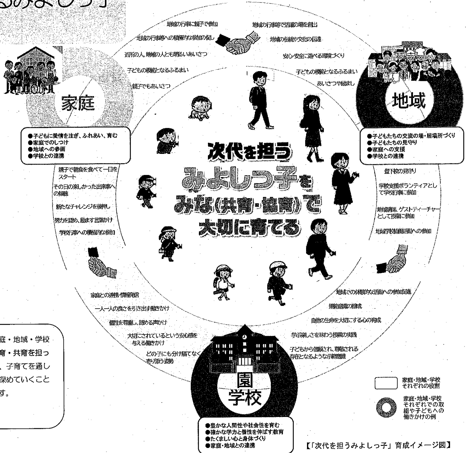
【「次代を担うみよしっ子」育成イメージ図】

協育とは、家庭・地域・学校が「協力して教育・共育を担っていく」ことで、子育てを通して相互の連携を深めていくことを意味しています。